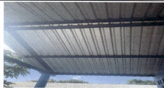
FOTO 3: SUSTITUCION DE LAMINA POR LAMINA TROQUELADA ALUZINC CALIBRE 26