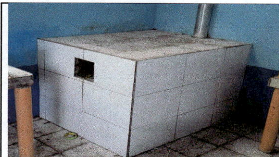
FOTO 6: SUSTITUCION DE ESTUFA RURAL (COMPLETA) INCLUYE CHIMENEA Y PLANCHA DE METAL.

Observación: Si es necesario se pueden agregar hojas adicionales y actualizar el número de hojas.